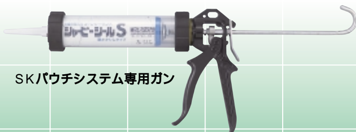
SKパウチシステム専用ガン